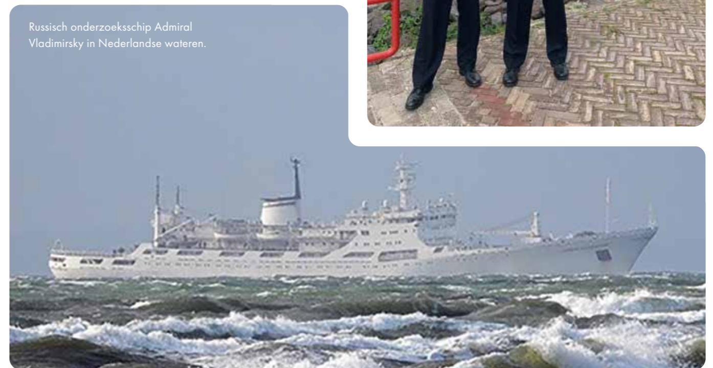
Russisch onderzoeksschip Admiral Vladimirsky in Nederlandse wateren.