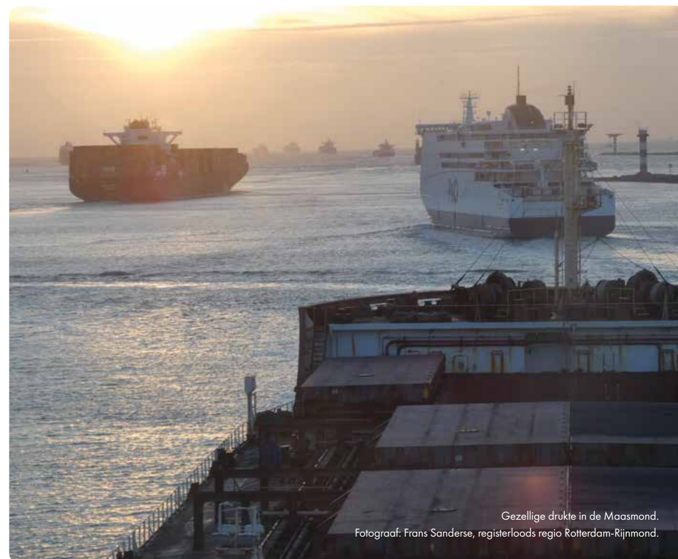
Gezellige drukte in de Maasmond.

Overzicht bieden is belangrijk, benadrukt Wychert. “Sommige projecten zijn heel zichtbaar voor de organisatie, zoals het onderhoud van de 'Procyon'. Andere zijn minder zichtbaar, zoals de vele projecten van ICT. ICT was al als