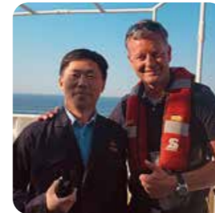
Oren en ogen op zee en in de havens Pagina 16

(* ) We gaan er vanuit dat de ingestuurde foto's rechtevrij zijn en we ze vrijelijk voor het Loodswezen kunnen gebruiken.